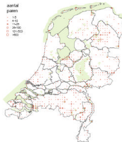
Verspreidingskaart Dodaars (broedvogel)

Huidig voorkomen en Natura 2000: In de periode 1999-2003 werden gemiddeld 2.200 dodaarsparen geteld, daarvan broedde naar schatting 38 % in onder de Vogelrichtlijn aangewezen gebieden. Door de diffuse verspreiding van de dodaars broedt een relatief groot aandeel in Natura 2000 gebieden waar instandhouding van deze soort geen deel uitmaakt van de doelstelling.