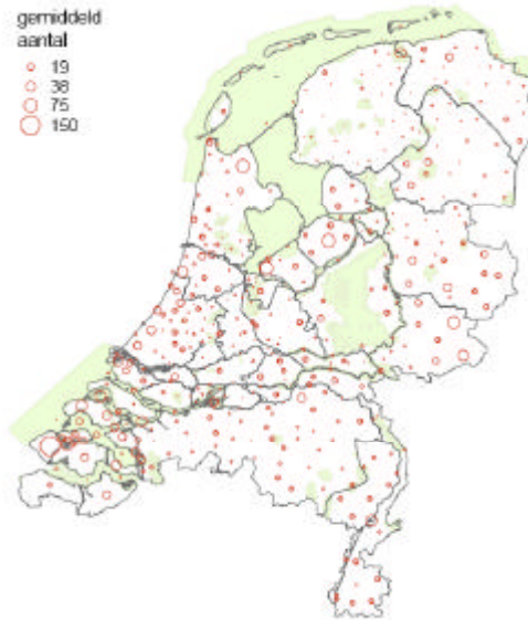
Verspreidingskaart dodaars (niet broedvogel)

Huidig voorkomen en Natura 2000: In de periode 1993-1997 overschreden de aantallen dodaarzen in geen enkel afzonderlijk gebied de 1%-norm. Waarschijnlijk ging het toen om 3.400 vogels, destijds was geen goede aantalsschatting beschikbaar. De enige twee gebieden met grotere aantallen, Veerse Meer en Grevelingen, zijn beide aangewezen als Natura 2000 gebied. Door de ruime, niet scherp begrensde ('diffuse') verspreiding van de soort over Nederland bevindt zich gemiddeld slechts ongeveer 19% van de dodaarzen binnen Vogelrichtlijngebieden.