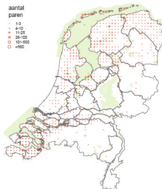
Verspreidingskaart bruine kiekendief

Huidige verspreiding en voorkomen binnen Nederland: Meer dan 95% van de Nederlandse bruine kiekendiefpopulatie broedt in Laag-Nederland. Bolwerken zijn de Waddeneilanden, het Friese merengebied, het Lauwersmeer, de Oostvaardersplassen en het Deltagebied (dat gebied herbergt een kwart van de landelijke populatie). Op de zandgronden in hoog Nederland komt de soort slechts spaarzaam voor door schaarste aan rustige broedgelegenheden en gebrek aan prooien in de omringende cultuurlandschappen.