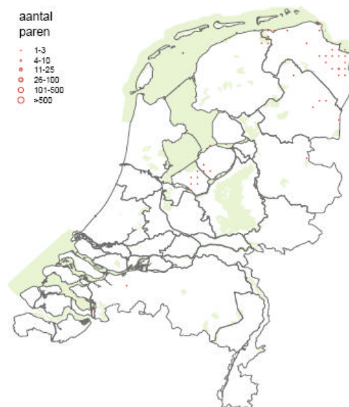
Verspreidingskaart grauwe kiekendief

Huidige verspreiding en voorkomen binnen Nederland: Het zwaartepunt van de verspreiding ligt in de akkerbouwgebieden van Oost-Groningen ( kerngebied Groninger Oldambt) en – in mindere mate - in Flevoland en het Lauwersmeer. 20 Buiten deze kerngebieden alleen incidentele broedgevallen in Overijssel (Engbertsdijkvenen), in de Drents-Groningse veenkoloniën en in het Fochteloërveen.